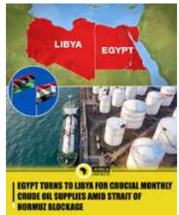
EGYPT TURNS TO LIBYA FOR CRUCIAL MONTHLY CRUDE OIL SUPPLIES AMID STRAIT OF HORMUZ BLOCKAGE